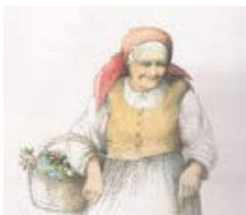
Zdroj: Ilustrace z knihy, Autor: Vladimír Tesář

Všechny obrázky budou vystaveny v knihovně.